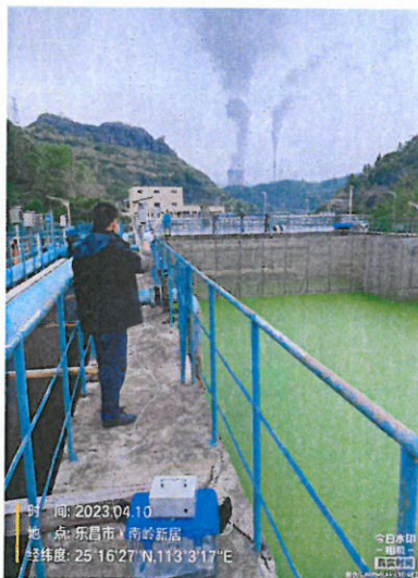
厂区内甲烷浓度最高点5#